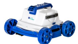
Robot Robot RKJ14