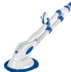
Limpiafondos automático Automatic cleaner 90399