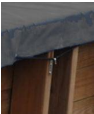
Cubierta de invierno Winter cover CI790205