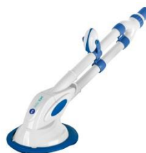
Nettoyeurs automatiques Puliscifondi automatici 90399