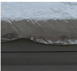
Winterabdeckung Winter cover CIKPCOR28