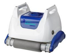
Roboter Robot RKA80